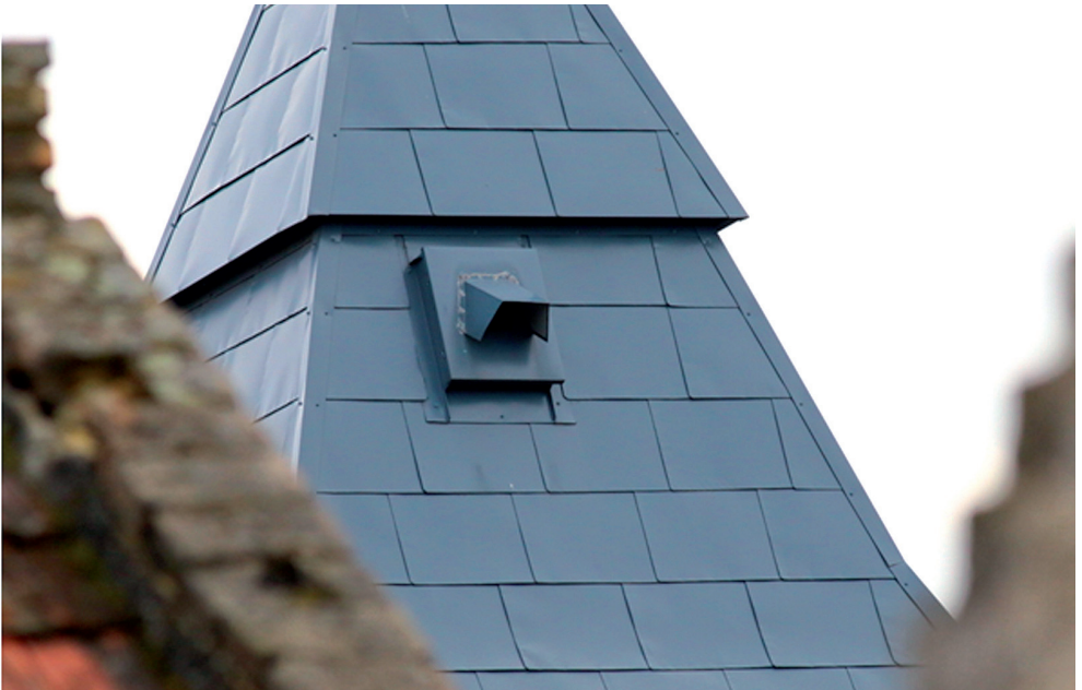
Gyöngybaglyoknak kialakított berepülőnyílás a süvegen

Hazánk keresztény templomaiban talán azóta költenek gyöngybaglyok, amióta tornyos templomok egyáltalán léteznek. A gyöngybaglyok a harangok fölötti toronytér egyik sötét sarkában nevelik fiókáikat, amelyeket a falu kertjeiből összeszedett sok bosszúságot okozó rágcsálóval etetnek. Az elmúlt ötven évben a templomok lezárása, felújítása, a harangok motorizálása azt eredményezte, hogy elsősorban a tömegesen betelepülő galambok miatt ezt a végtelenül hasznos fokozottan védett bagolyfajt is kizártuk a templomtornyokból. A gyöngybagoly így mára egy bizonytalan sorsú, veszélyeztetett tagjává vált a hazai madárvilágnak.