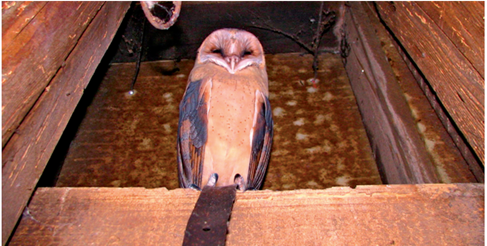
Gyöngybagoly pihen a toronykumulában

A helyi farmerek ültetvényeiken a rágcsálók ellen bevetett mérgekkel rengeteg gyöngybaglyot is akarattuk ellenére elpusztítottak. Svájci közbenjárásra módszert váltottak a gazdák, és a rágcsálók közvetlen gyérítése helyett inkább a rágcsálókra vadászó baglyok helyzetét kezdték segíteni új költőhelyek kialakításával. A baglyok meghálálták: a kényelmes ládákból nevelhették 5-6 fiókájukat, és a napi 15-25 rágcsáló elfogásával megoldották a rágcsálóproblémát is. Mindeközben pedig korábban ellenséges viszonyban álló gazdák kénytelenek voltak egymással beszélni, mivel a baglyok telepítése olyan közös jó célá vált, amely átívelt sok régi ellentét felett. A gyöngybagoly program a Közel-Kelet békefolyamatainak apró szimbólumává vált.